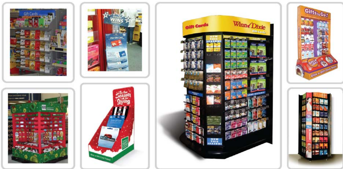
<< インコムの展開するギフトカードモール イメージ >>

(※ ギフトカード販売については別途、ギフトカード発行会社の承認または、契約などが必要な場合があります。)